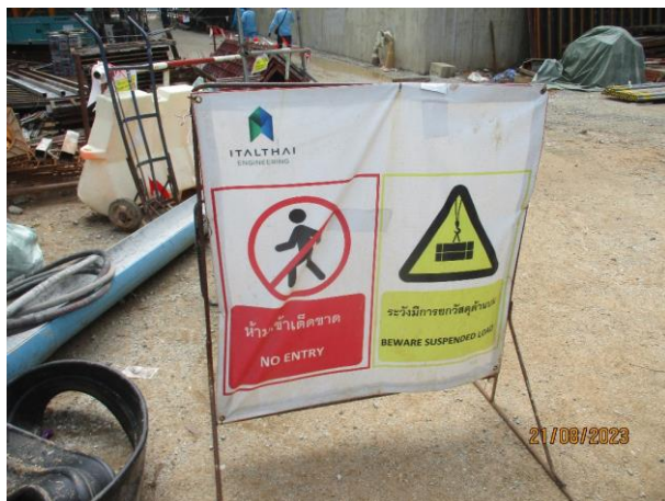
รูปที่ 2-30 ป้ายเตือนเขตอันตรายห้ามเข้าสำหรับผู้ที่ไม่เกี่ยวข้อง