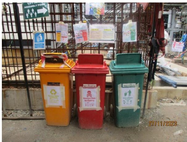
รูปที่ 2-17 ภาพของถังขยะแยกตามประเภท