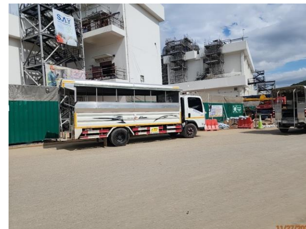
รูปที่ 2-24 รถรับ-ส่งคนงาน