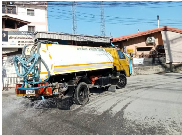
รูปที่ 2-3 การทำความสะอาดถนนชุมชน