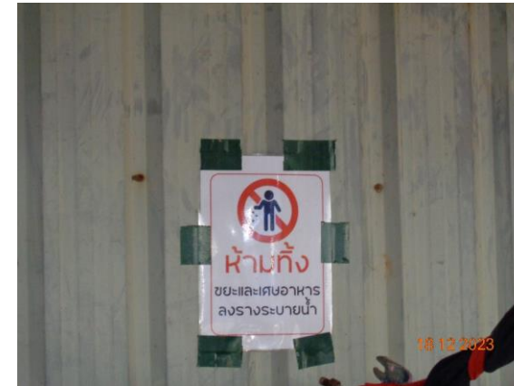
รูปที่ 2-15 ป้ายห้ามทิ้งขยะลงรางระบายน้ำ