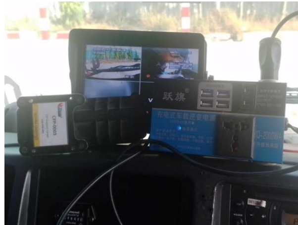
รูปที่ 2-27 การติดตั้งระบบ Global Positioning System (GPS)