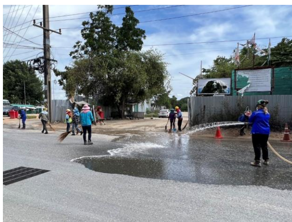
รูปที่ 2-53 ผู้รับเหมาก่อสร้างทำความสะอาดถนนบริเวณบ้านพัก