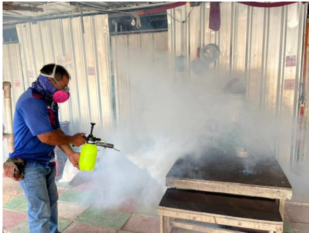
รูปที่ 2-50 การฉีดพ่นยุง (ที่พักคนงาน)