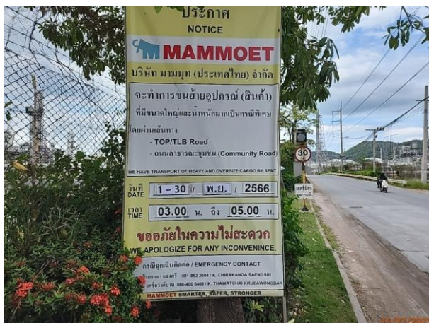
รูปที่ 2-19 ป้ายแจ้งกำหนดการขนส่งวัสดุขนาดใหญ่