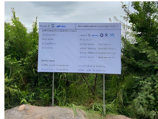
รูปที่ 2-22 ป้ายประชาสัมพันธ์โครงการ