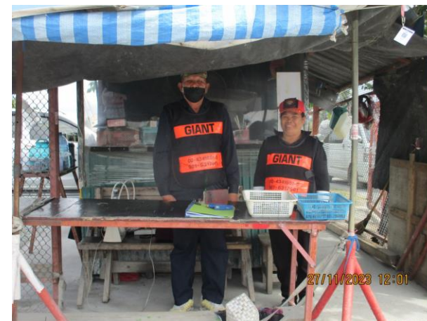
รูปที่ 2-31 เจ้าหน้าที่รักษาความปลอดภัย