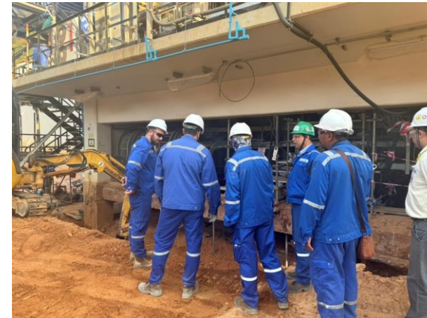
รูปที่ 2-34 หัวหน้างานควบคุมการทำงาน