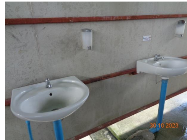
จุดล้างมือ