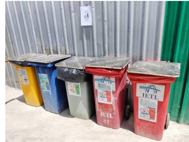
รูปที่ 2-48 ภาชนะรองรับของเสียแยกตามประเภท (บ้านพักคนงาน)