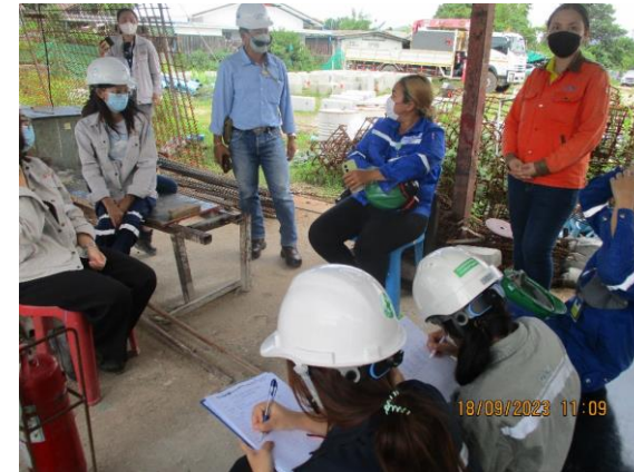
รูปที่ 2-46 การตรวจสอบที่פקคณงาน