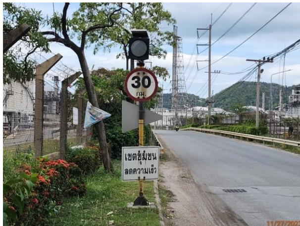
รูปที่ 2-21 ป้ายจำกัดความเร็วของรถในเขตชุมชน