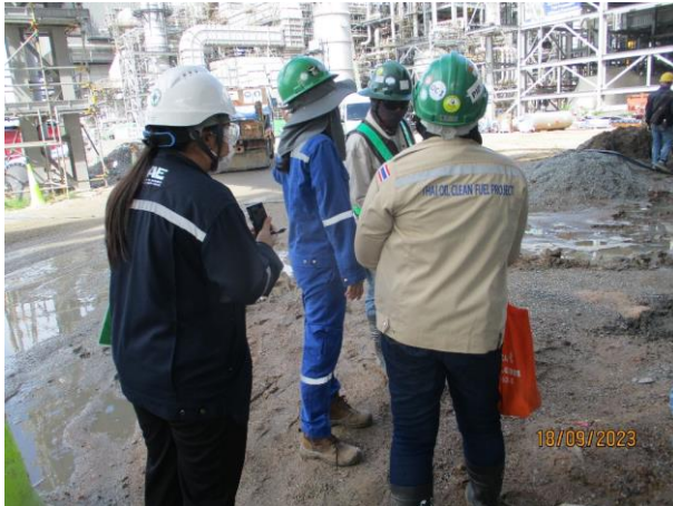
รูปที่ 2-1 หน่วยงานกลางเข้ามาดำเนินการติดตามตรวจสอบ