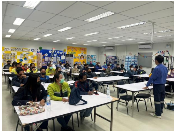
รูปที่ 2-28 การอบรมก่อนเข้าทำงาน