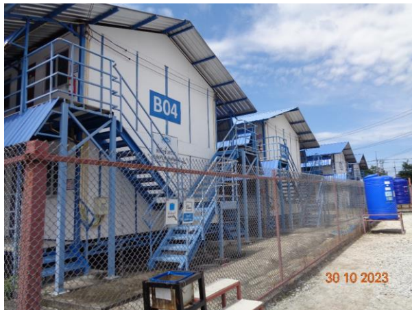
พื้นที่กักตัว (Quarantine area)