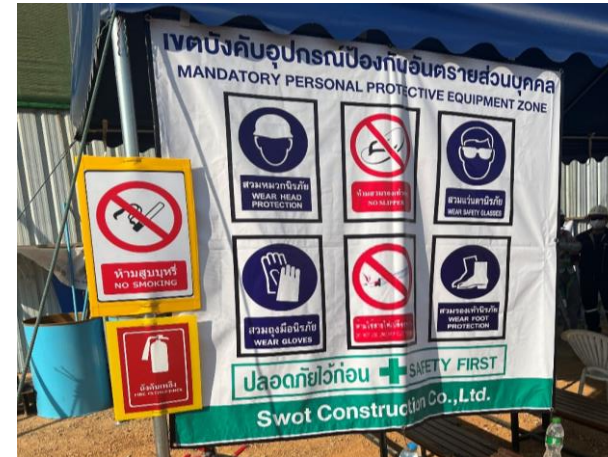
รูปที่ 2-29 ป้ายสัญลักษณ์เกี่ยวกับความปลอดภัยอาชีวอนามัย