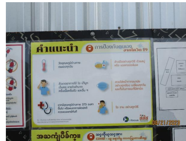
ป้ายแนะนำเกี่ยวกับการแพร่ระบาดของโรคติดเชื้อไวรัสโคโรนา 2019 (Covid-19)