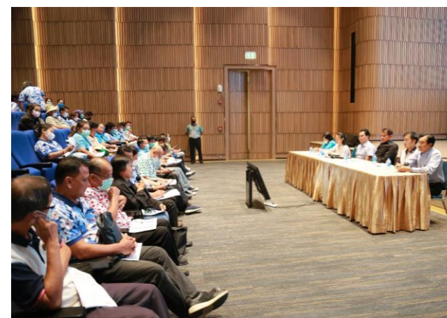
รูปที่ 2-54 การประชุมสามประสาน