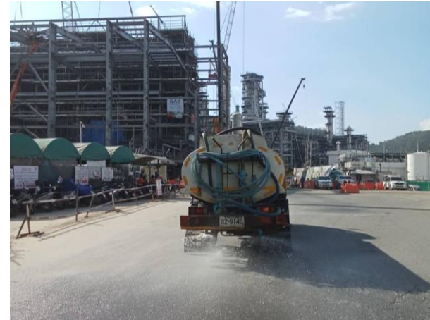
รูปที่ 2-2 การฉีดพรมน้ำป้องกันฝุ่นละออง