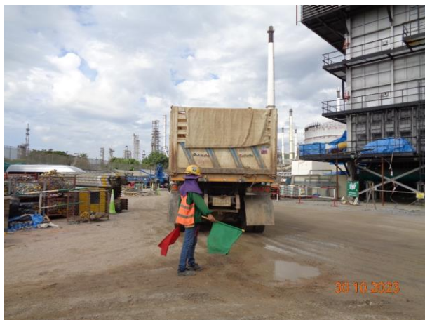
รูปที่ 2-23 เจ้าหน้าที่ดูแลรถที่เข้า-ออกพื้นที่ก่อสร้าง