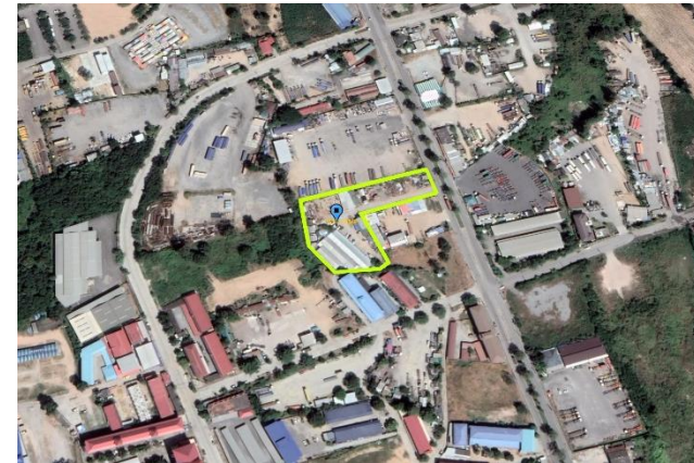
รูปที่ 2-44 พิกัดที่פקคณงาน