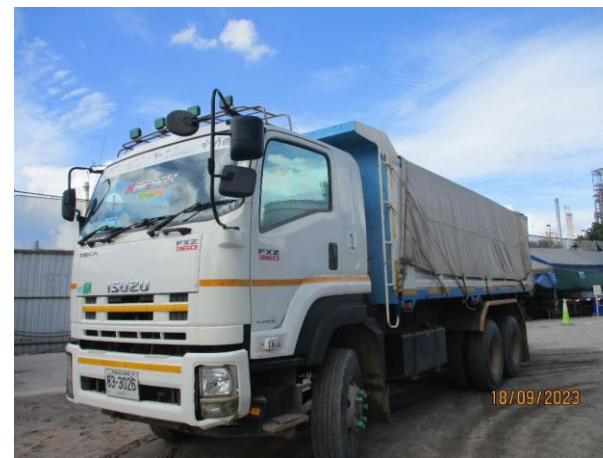
รูปที่ 2-5 การใช้ผ้าใบปิดคลุมส่วนบรรทุกของรถบรรทุก