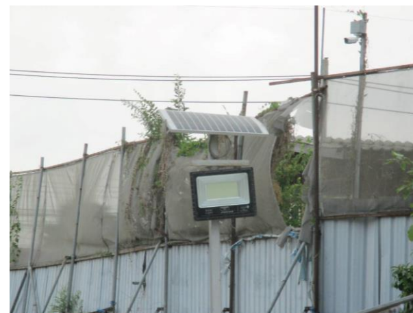
รูปที่ 2-36 ไฟฟ้าส่องสว่างฉุกเฉิน