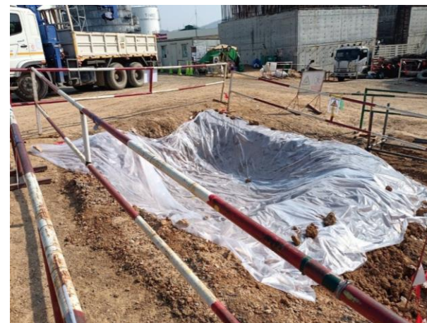
รูปที่ 2-11 บ่อพักรวบรวมตะกอนคอนกรีต