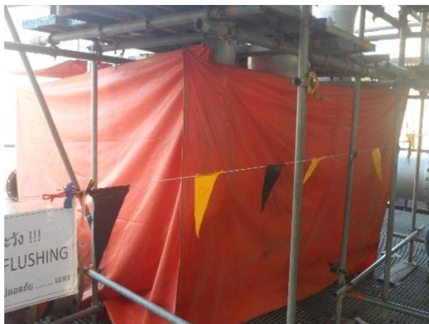
รูปที่ 2-4 การปิดคลุมด้วยผ้าใบทุกด้านเพื่อป้องกัน Copper slag พุ้งออกจากพื้นที่ปฏิบัติงาน