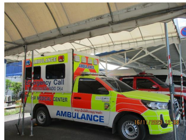
รูปที่ 2-38 รถพยาบาลภายในพื้นที่สำนักงานสนาม