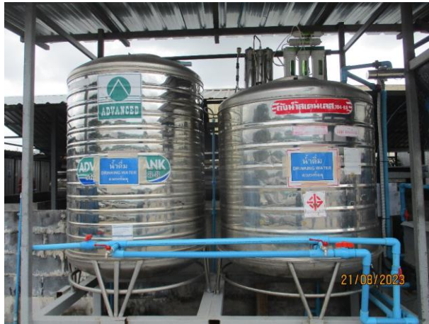
รูปที่ 2-47 น้ำดื่ม (บ้านพักคนงาน)