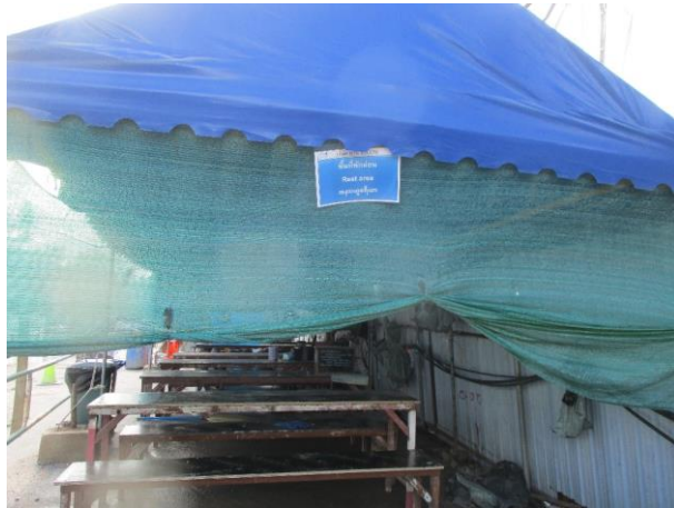
รูปที่ 2-39 ที่พักผ่อนในช่วงหยุดพัก