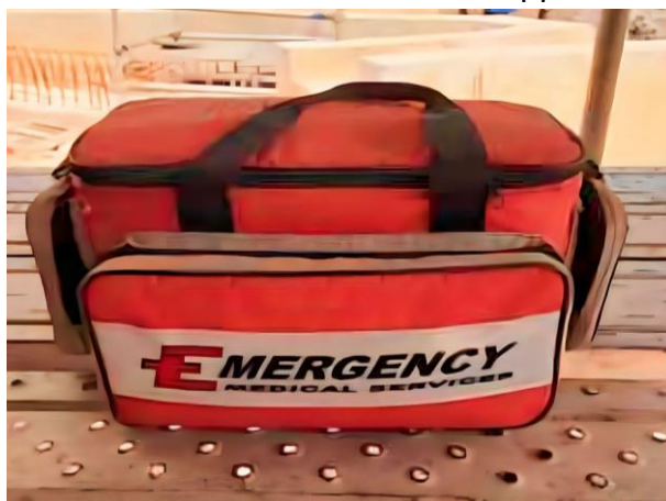
รูปที่ 2-37 อุปกรณ์ปฐมพยาบาลเบื้องต้น