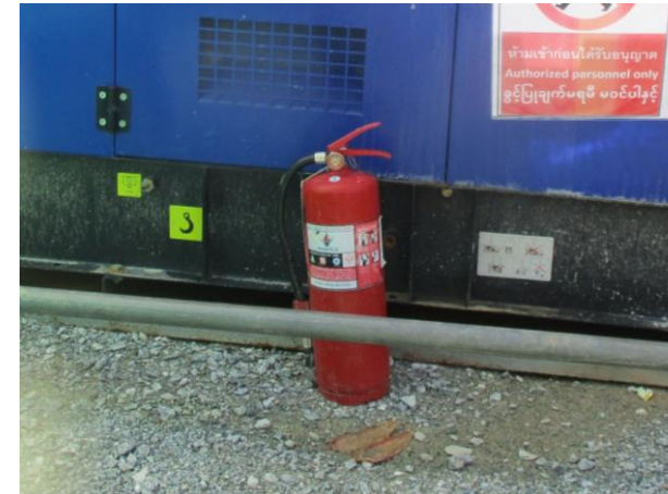
รูปที่ 2-42 ถังดับเพลิง