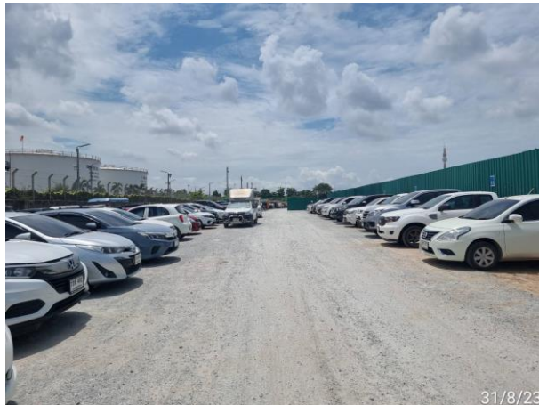
รูปที่ 2-25 พื้นที่จอดรถรับ-ส่งคนงาน