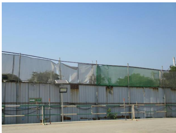
รูปที่ 2-8 แนวรั้วเขตพื้นที่ก่อสร้าง