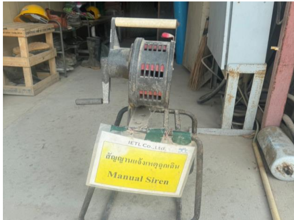
รูปที่ 2-43 สัญญาณเตือนภัย