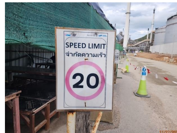
รูปที่ 2-20 ป้ายจำกัดความเร็วของรถในพื้นที่ก่อสร้าง