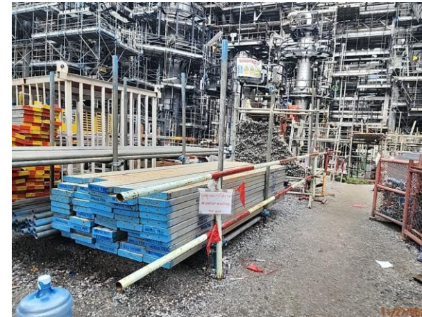
รูปที่ 2-13 พื้นที่จัดเก็บวัสดุก่อสร้าง