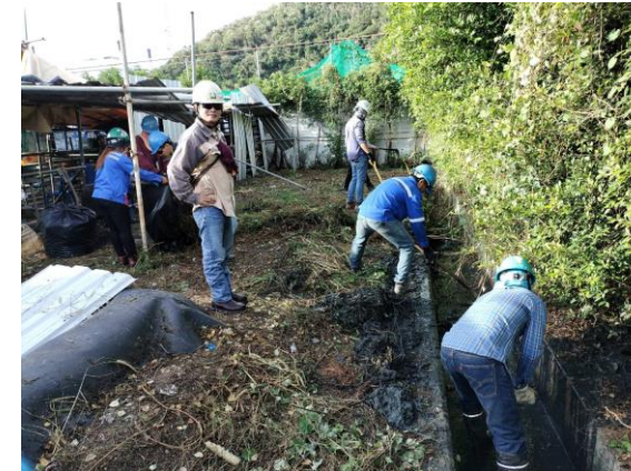
รูปที่ 2-14 การทำความสะอาดรางระบายน้ำและขุดลอกตะกอนดิน