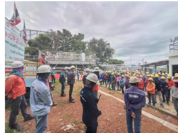
รูปที่ 2-16 การประชุมชี้แจงการทำงานอย่างปลอดภัยก่อนเริ่มปฏิบัติงาน