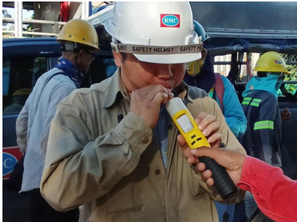
รูปที่ 2-41 การตรวจวัดแอลกอฮอล์