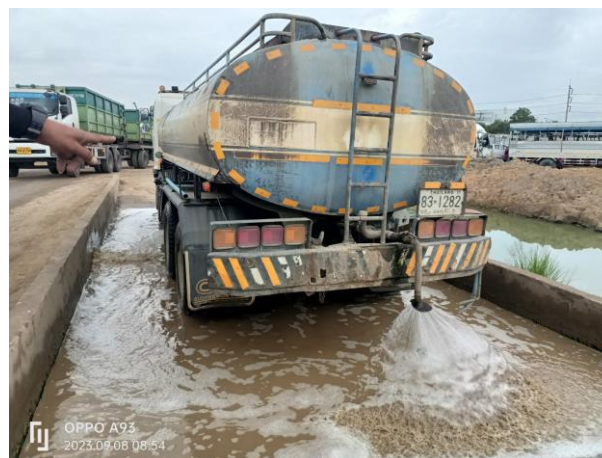
รูปที่ 2-6 ที่ล้างล้อรถบรรทุก