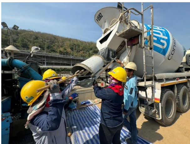
รูปที่ 2-10 การทำความสะอาดรางระบายคอนกรีตของรถชนคอนกรีต