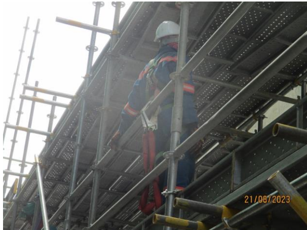
รูปที่ 2-33 การสวมใส่อุปกรณ์คุ้มครองความปลอดภัยส่วนบุคคล