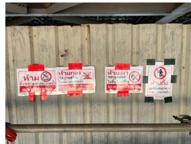
รูปที่ 2-18 ป้ายห้ามเผาขยะในพื้นที่ก่อสร้าง