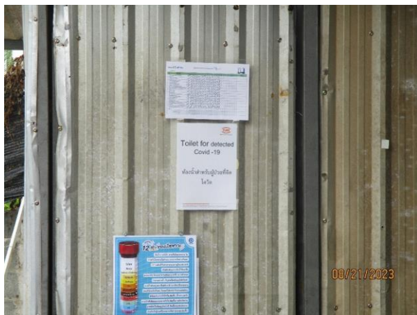
ห้องสำหรับผู้ป่วยที่ติดเชื้อไวรัสโคโรนา 2019 (Covid-19)