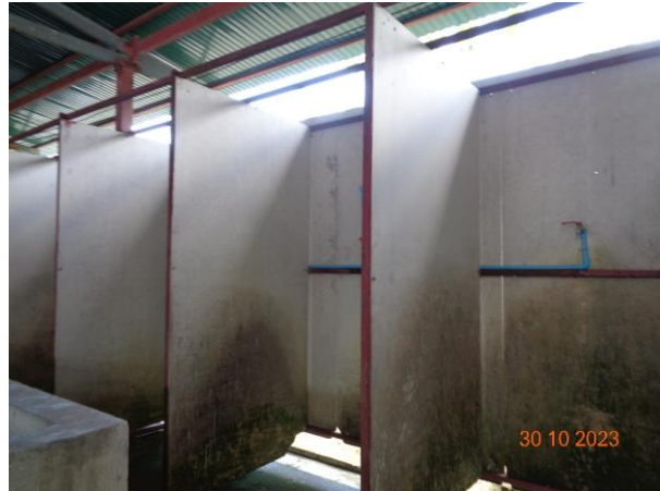
รูปที่ 2-49 ห้องน้ำ ห้องส้วม ที่ติดตั้งระบบบำบัดน้ำเสีย (บ้านพักคนงาน)