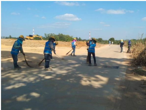
รูปที่ 2-7 พนักงานทำความสะอาดถนน