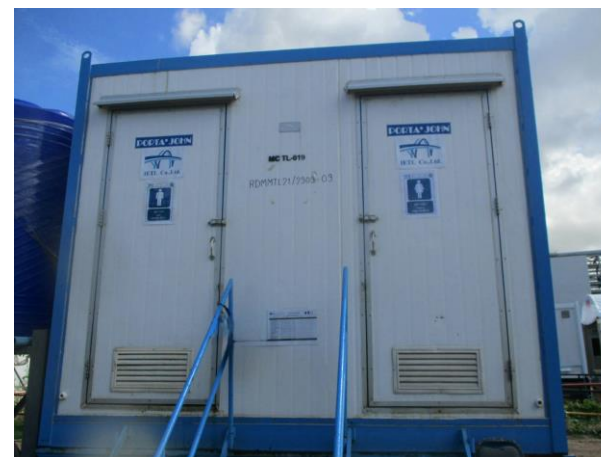
รูปที่ 2-9 ห้องน้ำ ห้องส้วม พร้อมระบบบำบัดน้ำเสียสำเร็จรูปแบบเคลื่อนที่