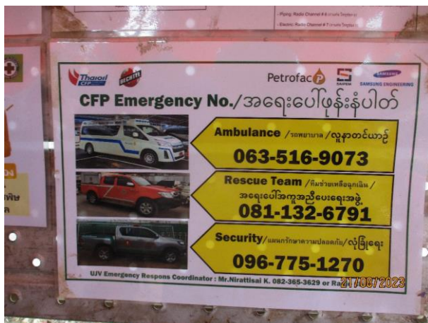
รูปที่ 2-35 ป้ายแสดงหมายเลขโทรศัพท์ของหน่วยงานที่เกี่ยวข้อง เพื่อขอความช่วยเหลือในกรณีเกิดเหตุฉุกเฉิน