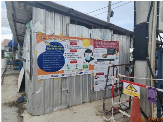
รูปที่ 2-45 ป้ายประชาสัมพันธ์ด้านสุขภาพและป้องกันโรคติดต่อ