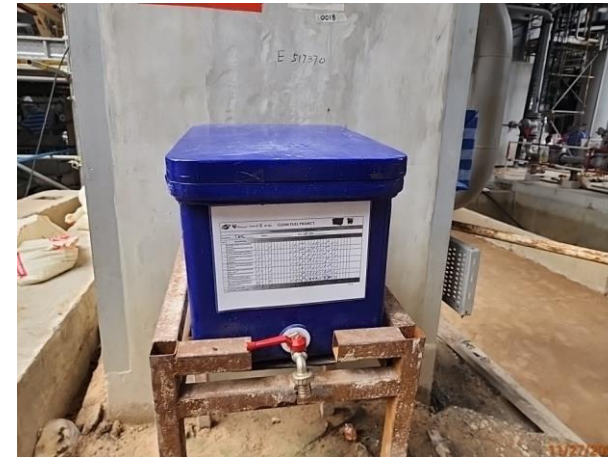
รูปที่ 2-40 น้ำดื่ม