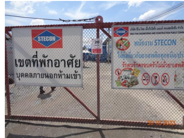
รูปที่ 2-51 ป้ายประชาสัมพันธ์พื้นที่พักคนงาน