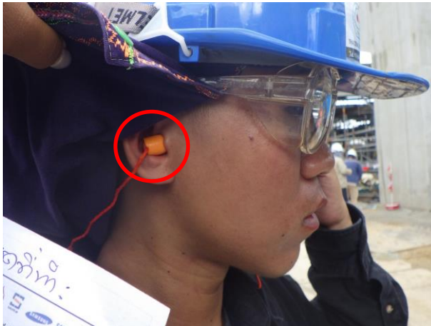
รูปที่ 2-32 การสวมใส่อุปกรณ์ลดเสียงและป้ายเตือนให้สวมใส่อุปกรณ์ลดเสียง